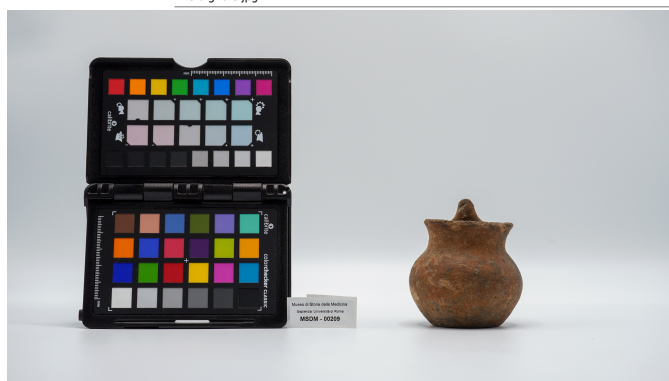
file digitale jpg