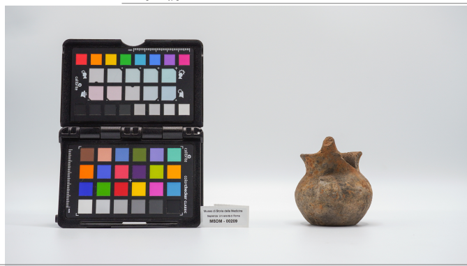
file digitale jpg