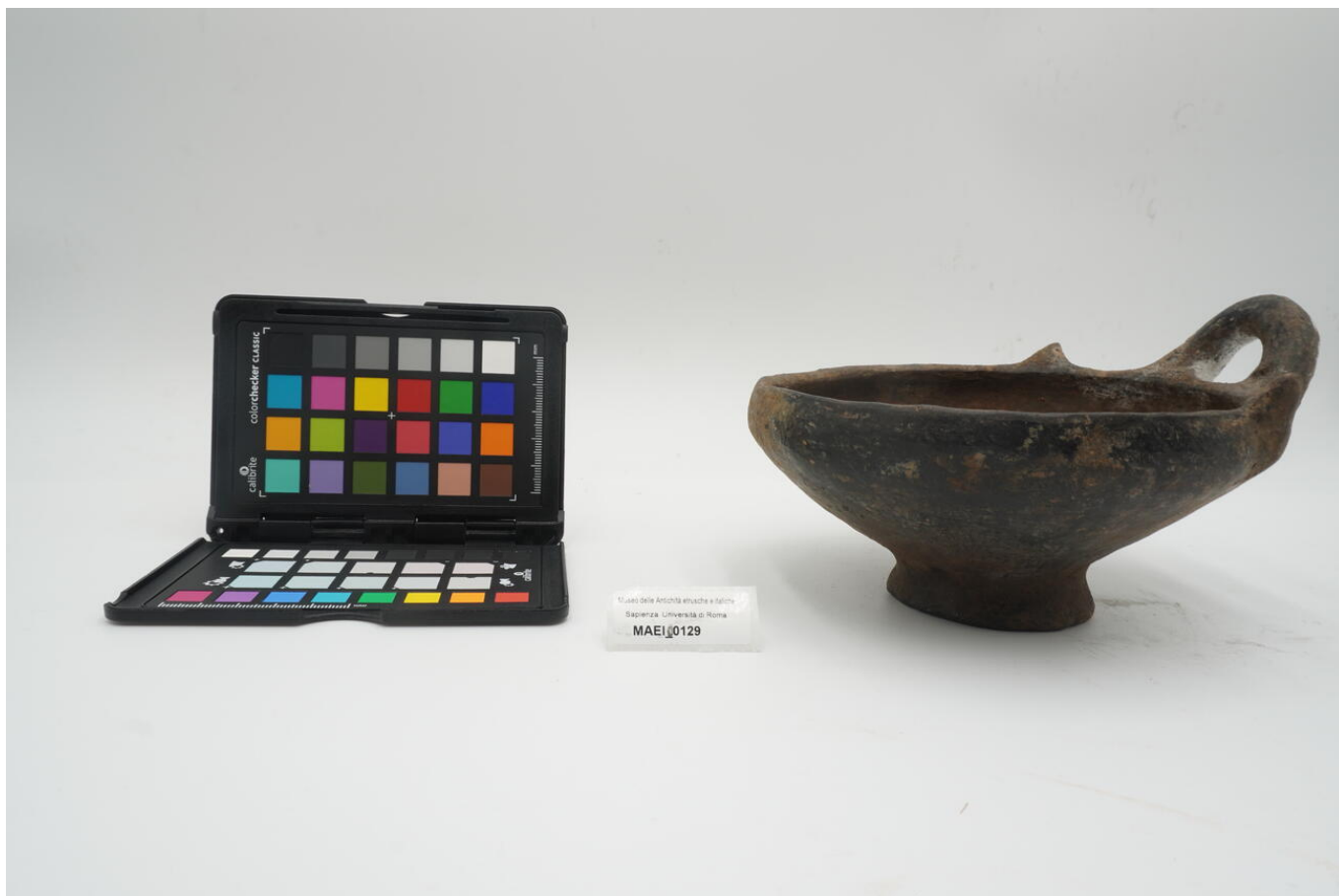
Uasi della Antichità etrusca e latina Sapienza Università di Roma MAEI_0129