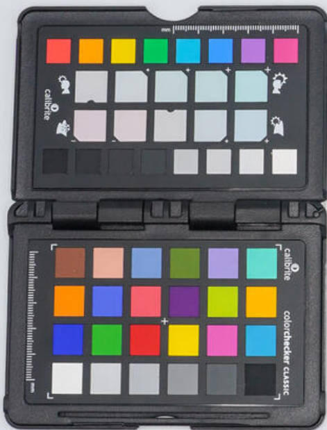
Museo di Storia della Medicina Spagna - Università di Roma MSDM - 00711