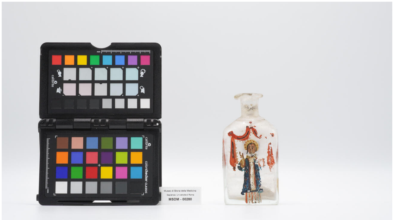
Museo di Storia della Medicina Sapienza Università di Roma MSDM - 00280