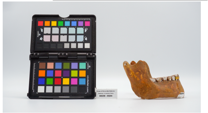
file digitale jpg