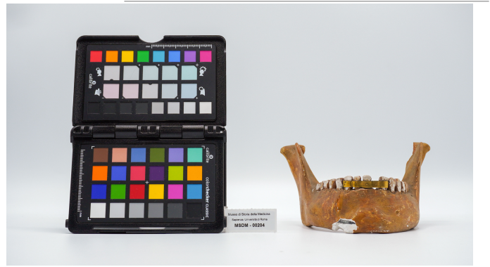
file digitale jpg