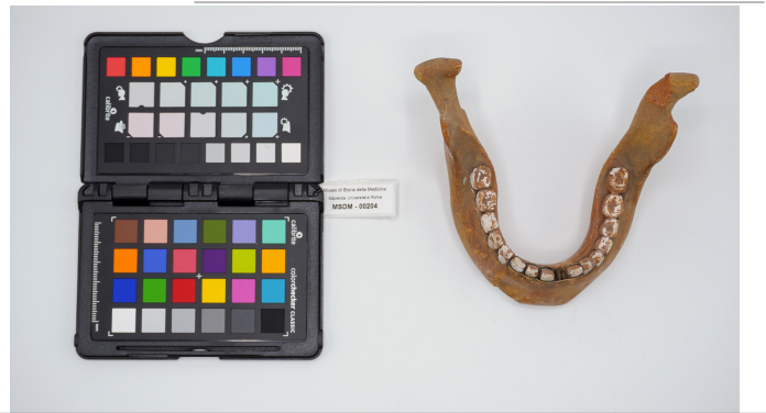
file digitale jpg