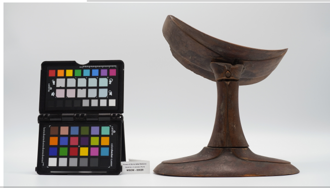
file digitale jpg