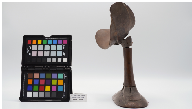
file digitale jpg