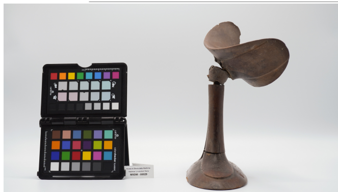
file digitale jpg