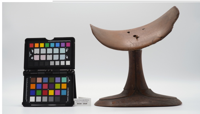
file digitale jpg